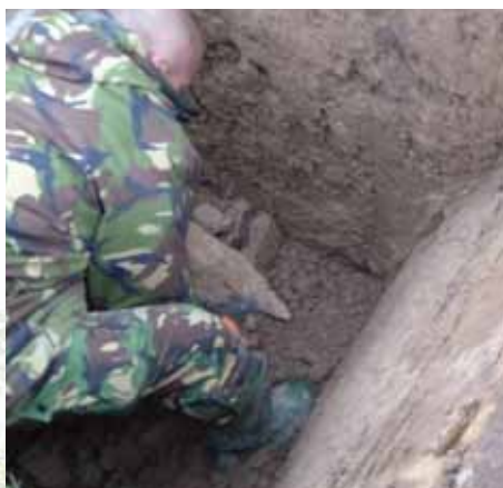
Gecontroleerd tot ontploffing gebrachte munitie uit de 2e wereldoorlog op 19 februari jl.