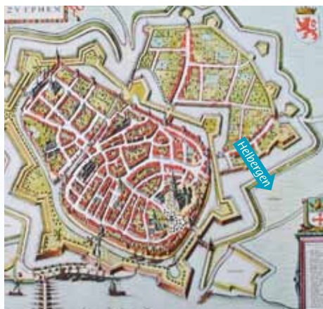
Zutphen omstreeks 1645

Aan het einde van de 2e wereldoorlog bevonden zich Duitse stellingen en het militaire veer op Park Helbergen. Er is hier stevig gevochten. Daar zijn de gevonden munitieresten stille getuigen van. Niet alleen reeds ontplofte munitie maar ook nog niet ontplofte munitie is er de afgelopen maand aangetroffen bij het archeologische en bodemdetectie onderzoek. Dit is gecontroleerd tot ontploffing gebracht op 19 februari jl. Op de website ziet u de opbrengst van de aangetroffen munitie en kunt u filmpjes bekijken van de tot ontploffing gebrachte munitie. ●